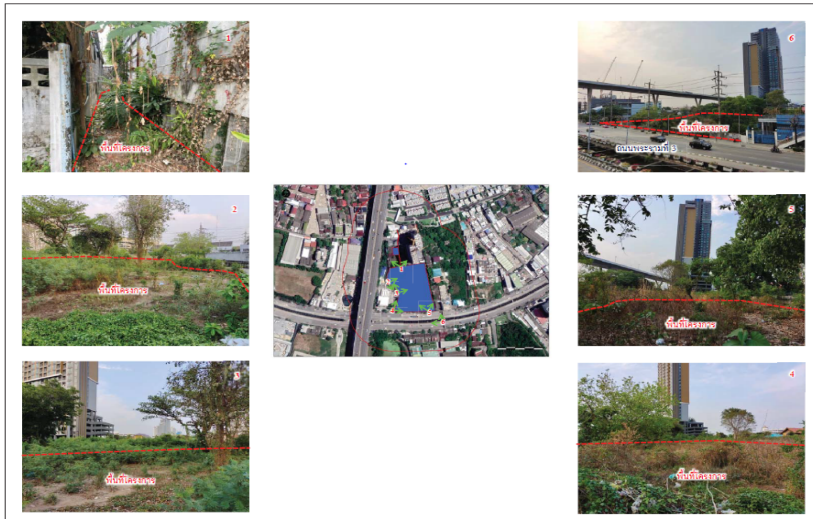
รูปที่ 2.1-3 สภาพพื้นที่ก่อนการพัฒนาโครงการ (เดือนมีนาคม 2564)